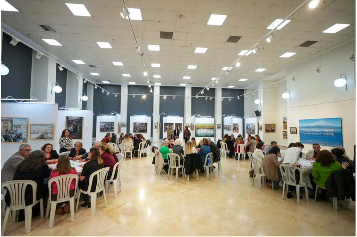
Resim 1 “Güvenli Kent Çalıştayı Çalışma Grupları”