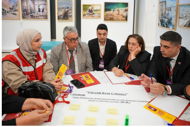
Resim 3 "Güvenli Kent Çalıştayı 1.Oturum Görüşmeleri"

Katılımcılardan elde edilen veriler doğrultusunda her masa 5 ana mekânsal başlık altında ayrılmıştır. Aşağıda her başlıkta önce tespit edilen sorunlar, ardından çözüm önerileri sunulmuştur.