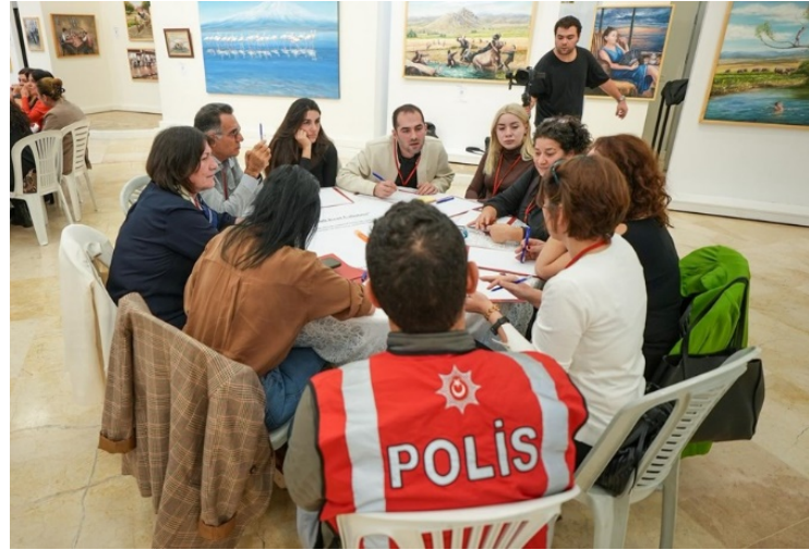
Resim 4 "Güvenli Kent Çalıştayı 1.Oturum Görüşmeleri"