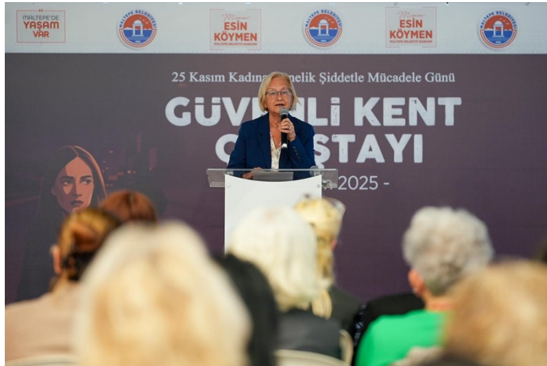
Resim 11 “Güvenli Kent Çalıştayı Değerlendirme Konuşması”

Bu çalıştay raporu, Maltepe'de güvenli kent politikalarının güçlendirilmesi ve kadınların kent hakkının korunması için yol gösterici bir belge niteliğindedir.