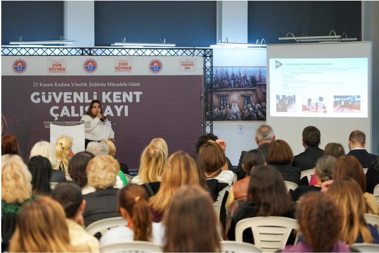
Resim 2 “Güvenli Kent Çalıştayı Sunum”

Çalışmaya katılım sağlayan kurumlar; İlçe Emniyet Müdürlüğü, CEİD (Cinsiyet Eşitliği İzleme Derneği), Maltepe Kent Konseyi, KAPDER(Kadın ve Aile Psikoloji Danışmanlık Eğitim Derneği), AÇEV (Anne Çocuk Eğitim Vakfı), Maltepe Belediyesi Meclis Üyeleri, Maltepe ilçesi mahalle muhtarları, Maltepe Belediyesi personelleri, Maltepe Cumhuriyet Kadınları Derneği, TAPV(Türkiye Aile Sağlığı ve Planlaması Vakfı), Maltepe Üniversitesi Kadın ve Aile Çalışmaları Uygulama ve Araştırma Merkezi (MÜKÇAM).