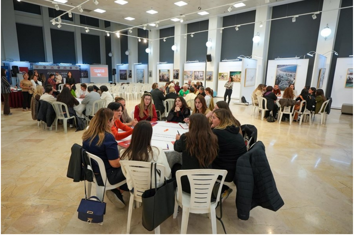
Resim 9 “Güvenli Kent Çalıştayı Oturum Görüşmeleri ”