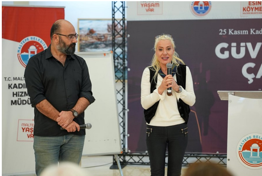
Resim 10 “Güvenli Kent Çalıştayı Yerel Yönetimlerle Şiddet Haritası Üzerine Görüşler”

Kent güvenliğinin şiddetle mücadelede veri odaklı ele alınabilmesi amacıyla çalıştayın ikinci oturumunda “Şiddet Haritası ve Yerel Yönetimlerin Rolü” tartışılmıştır. Oturum, kolaylaştırıcı moderasyon eşliğinde soru-cevap ve yorum paylaşımı şeklinde yürütülmüştür. Katılımcılara yöneltilen sorular; harita içeriği, yöntemi ve kurumlar arası iş birliği mekanizmaları üzerine olmuştur.