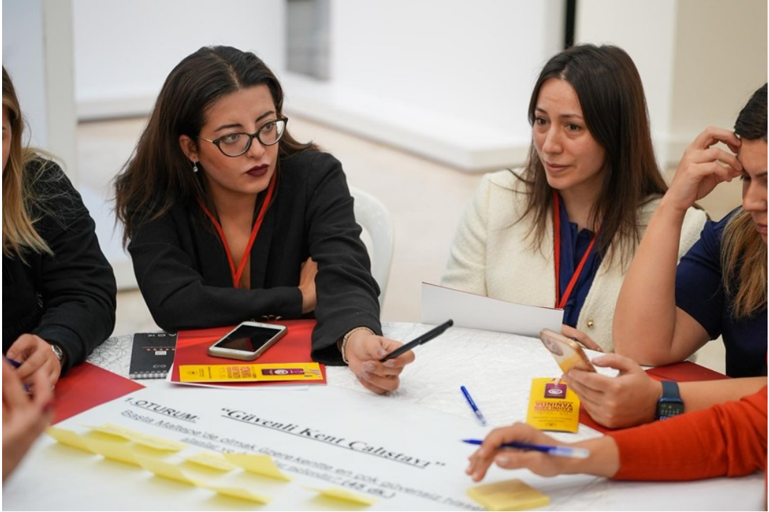
Resim 7 "Güvenli Kent Çalıştayı 2.Oturum Görüşmeleri "