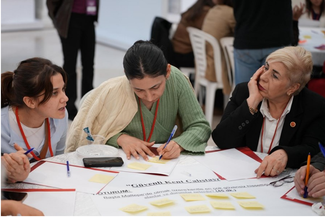
Resim 8 "Güvenli Kent Çalıştayı 2.Oturum Görüşmeleri "